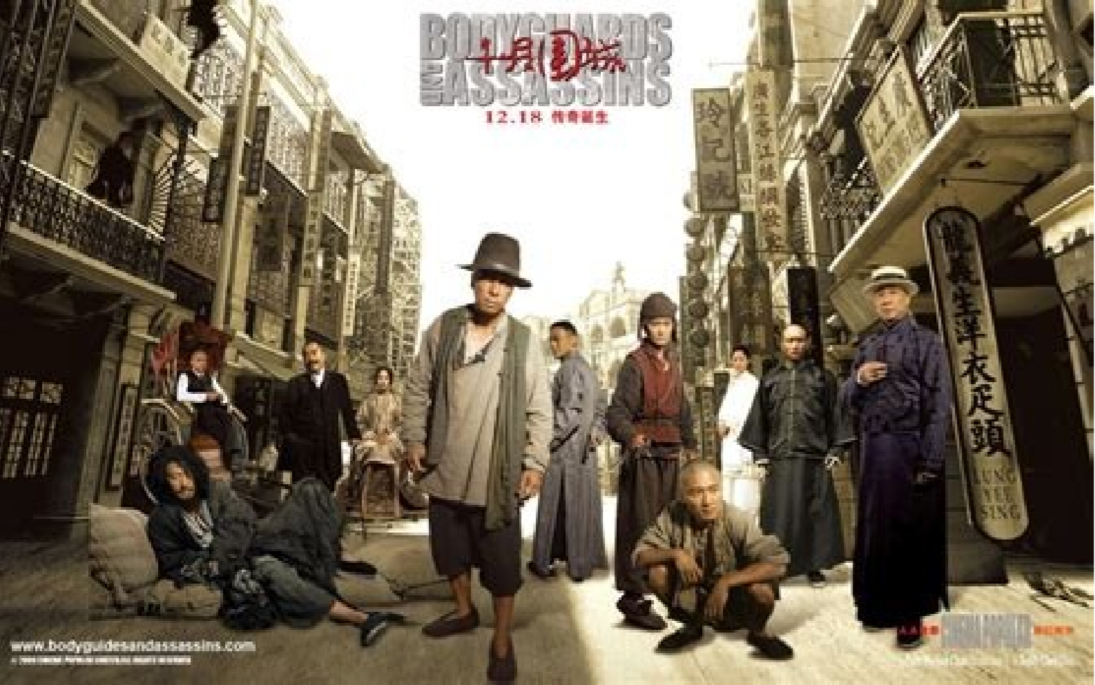
Bodyguards and assassins full movie free online. Bodyguards and assassins full movie free download.